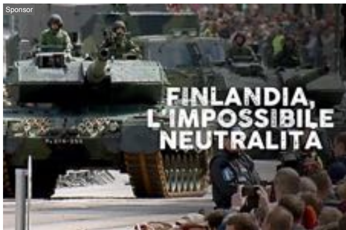
Finlandia, l'impossibile neutralità