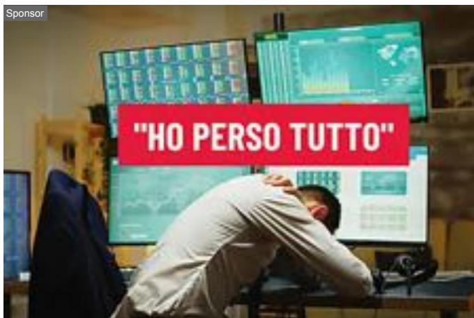
Perché il 75% dei trader perde soldi? Campione spiega il vero motivo