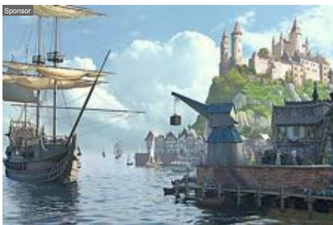
Il gioco Vintage "da giocare". Nessuna installazione.