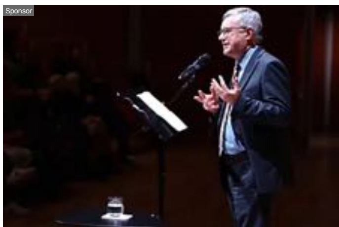
Tre lezioni di Alessandro Barbero: La schiavitù